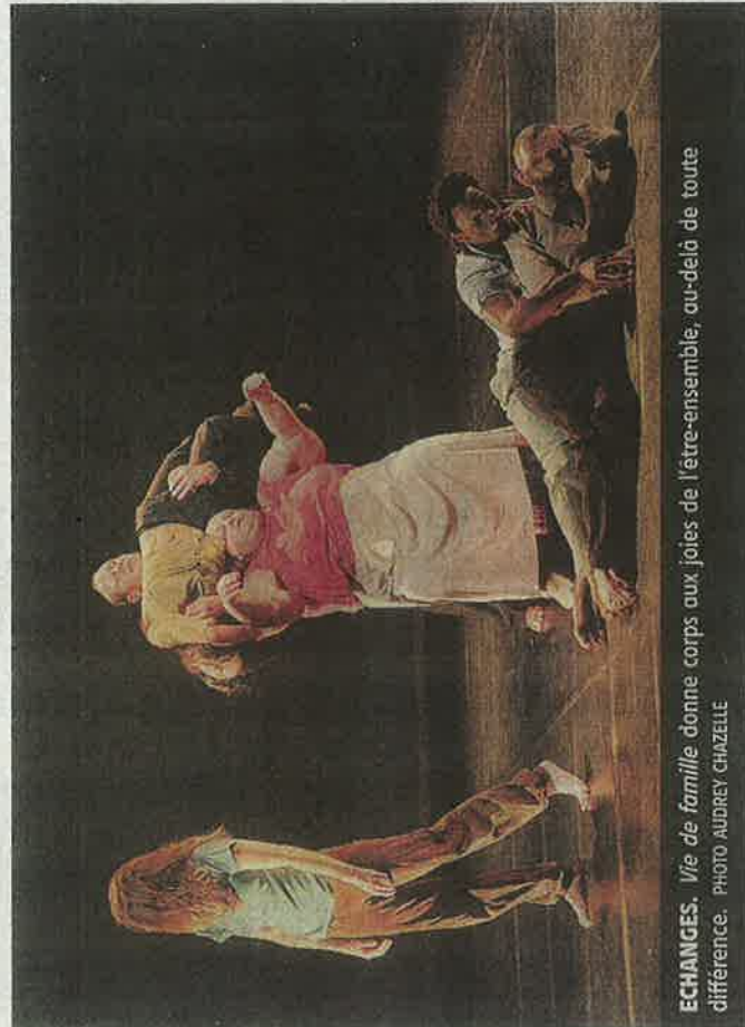
ECHANGES. Vie de famille donne corps aux joies de l'être-ensemble, au-delà de toute différence.