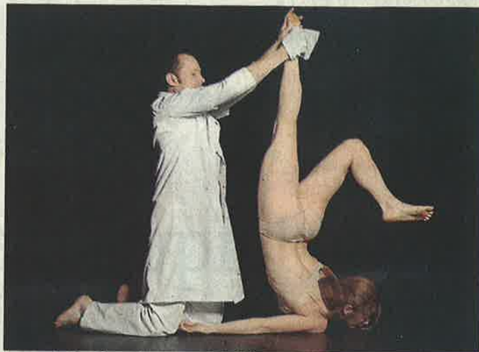
Le spectacle « Chambre 10 », ce soir à l'Estive, évoque le rapport d'une patiente et de ses médecins.