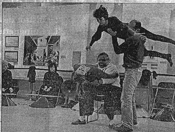
RÉPÉTITION. On sent déjà une harmonie.

blaisir et dé- montrer à gré la diffé- vent faire e monde ». ne Guylaine onsable de CH Esquirol, et des ate- rique et de és aux pa- re hospita- cle en résul- ersonnelle". usique. Sui- ne divertit. aussi beau- s, s'écouter,